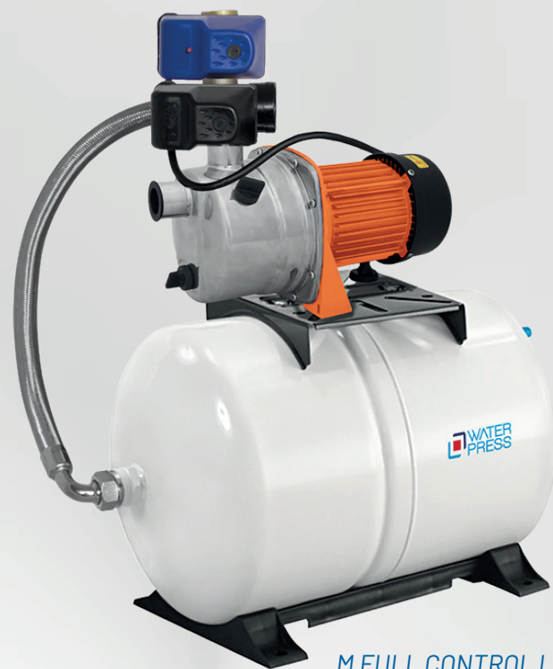
M FULL CONTROL L