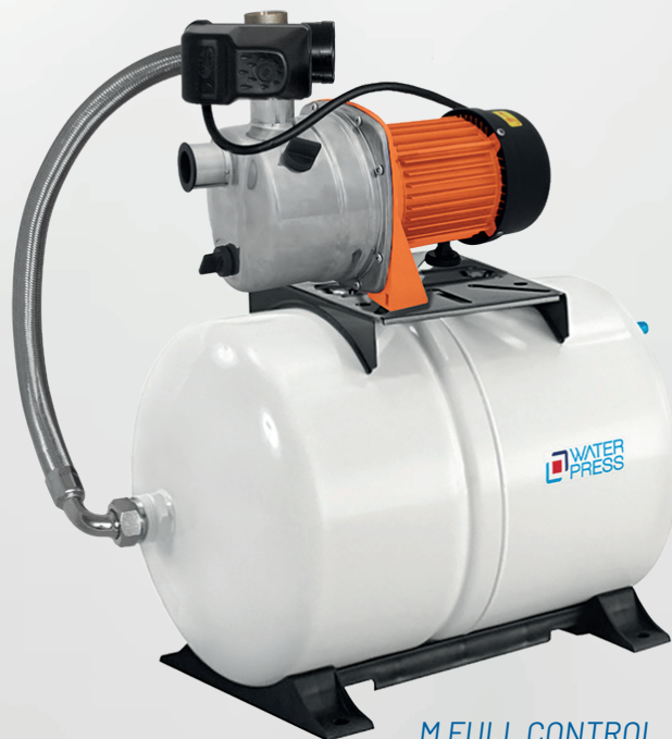
M FULL CONTROL