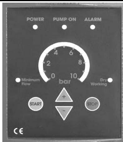
220 - 230 Vac Napájení měniče