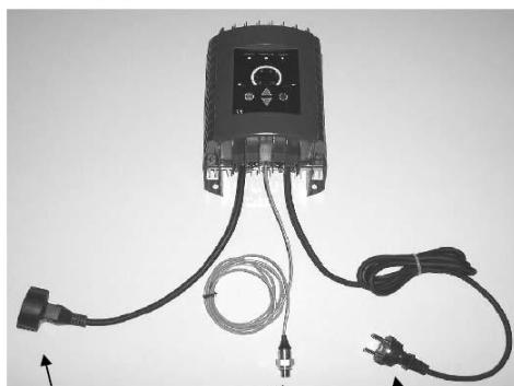
Napájení motorového čerpadla